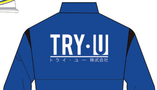
▲ユニフォームデザイン加工 胸や背中にプリントや刺繍を加工