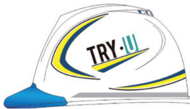
▲ヘルメットデザイン加工